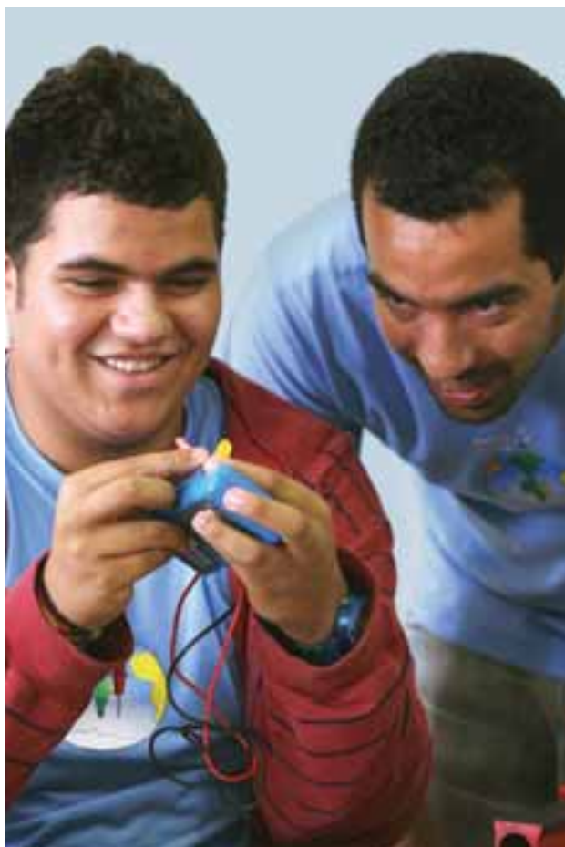
Centro de Educação Científica do Semiárido

objetivos comuns, de realização conjunta para projetos ou atividades visando à melhoria da competitividade das empresas integrantes. O programa está trabalhando com 52 redes, envolvendo 278 empresas nos diversos APL que se encontram em estágios distintos.