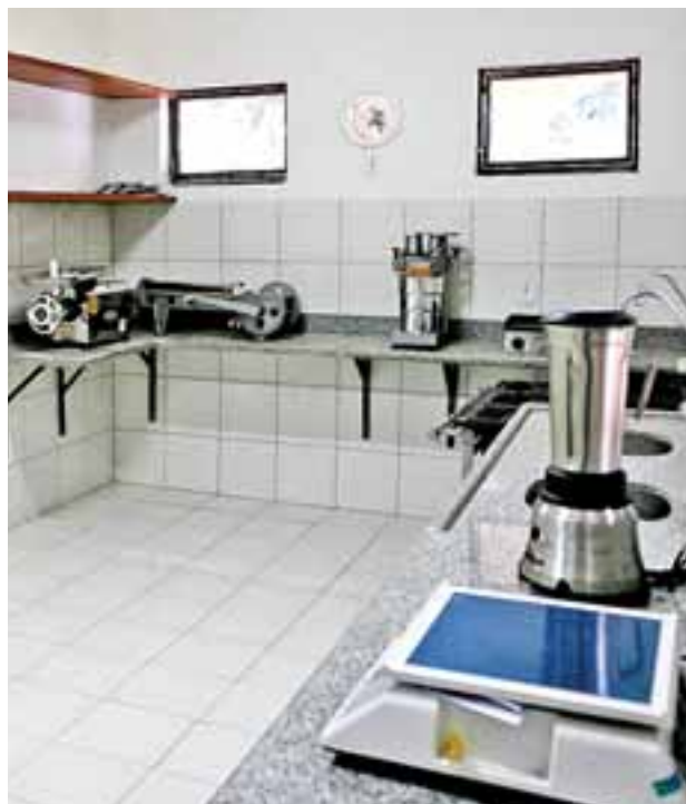
Laboratório do CVTT de Senhor do Bonfim