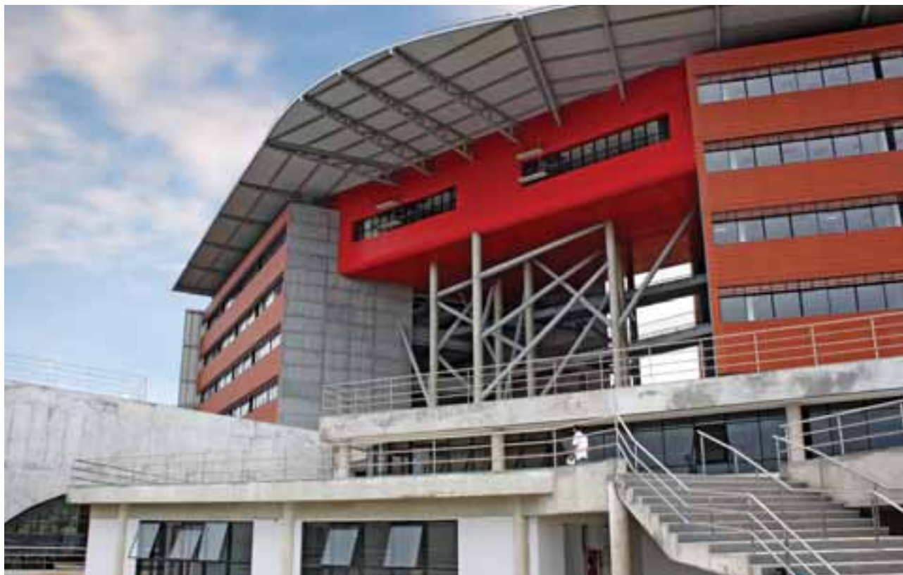
Parque Tecnológico de Salvador