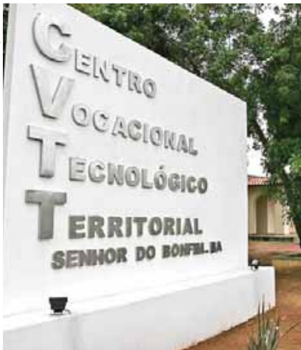
Os Centros Vocacionais Tecnológicos Territoriais promovem o acesso ao conhecimento científico e tecnológico