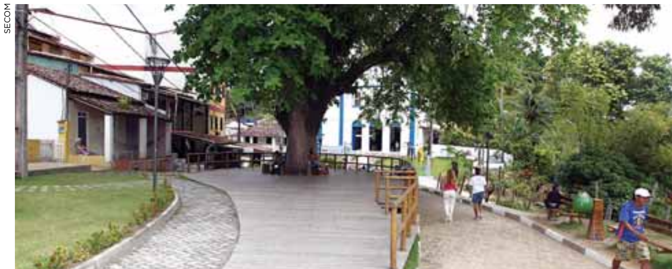
Obras de requalificação em Morro de São Paulo

Do montante desembolsado neste exercício, 79% corresponderam a recursos de financiamento externo e 21% a recursos de contrapartida local.