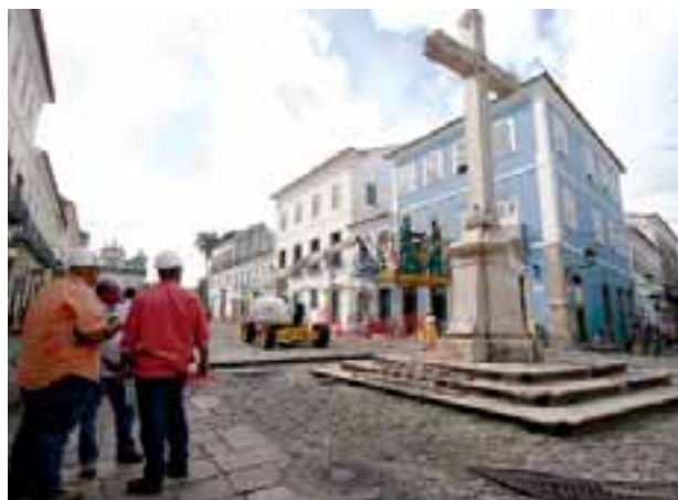
Obras no Centro Histórico de Salvador

A incorporação do Sistema Integrado de Informações Turísticas consolidou-se pela qualidade e capacidade de disseminação de informações de interesse do visitante, pelos meios de comunicação. O sistema disponibiliza dados organizados sobre aeroportos, estações rodoviárias, áreas turísticas e, principalmente, sobre o circuito do Carnaval. Os resultados alcançados em 2011 estão demonstrados no Quadro 3.