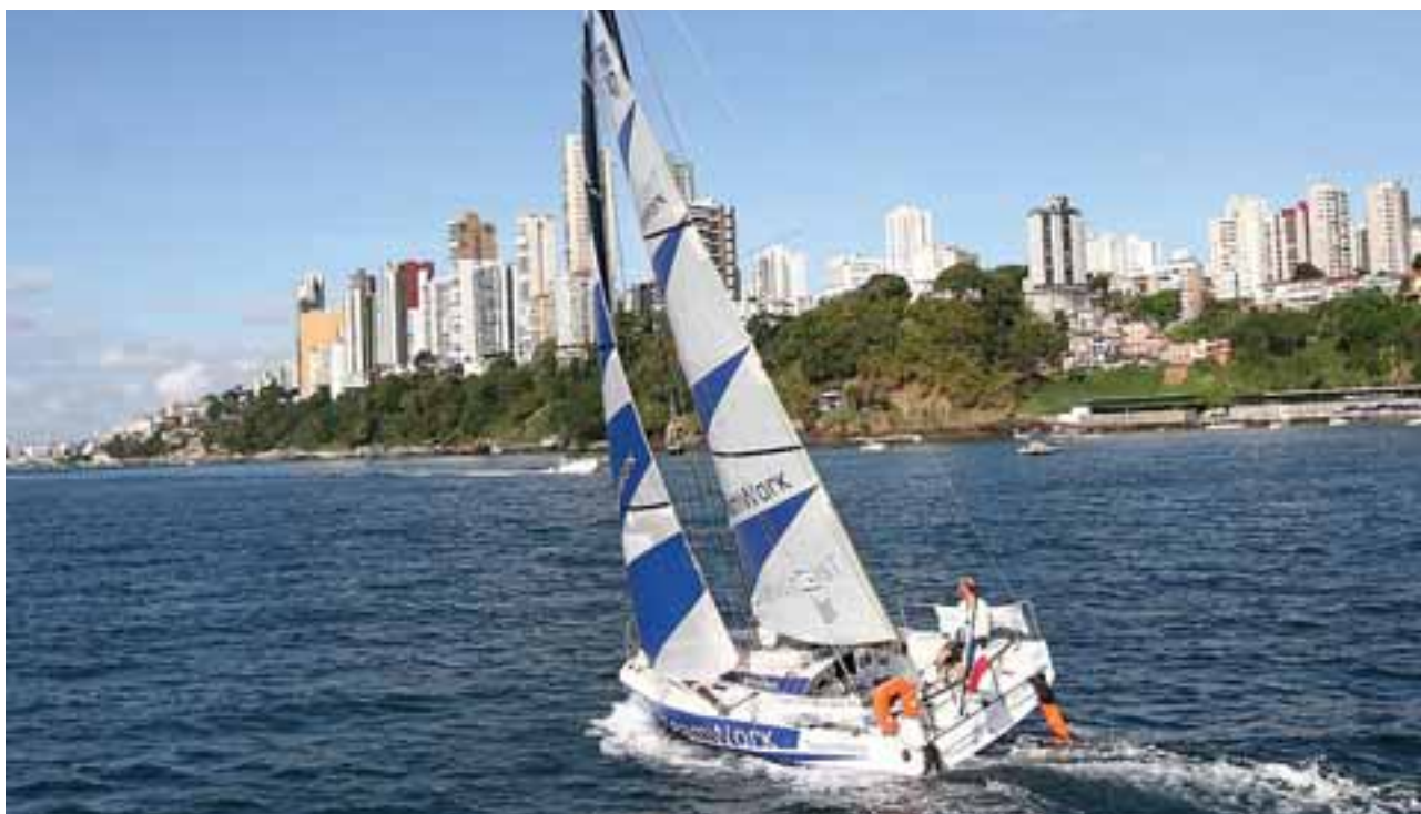
Chegada em Salvador do barco vencedor da regata La Charente-Maritime Bahia 2011

da operação de crédito junto ao Banco Interamericano de Desenvolvimento - BID, o qual destinará, por meio de contrato de empréstimo, o valor de US$ 84,7 milhões, 40% dos quais serão aportados pelo Estado da Bahia, a título de contrapartida local, para o financiamento das ações.