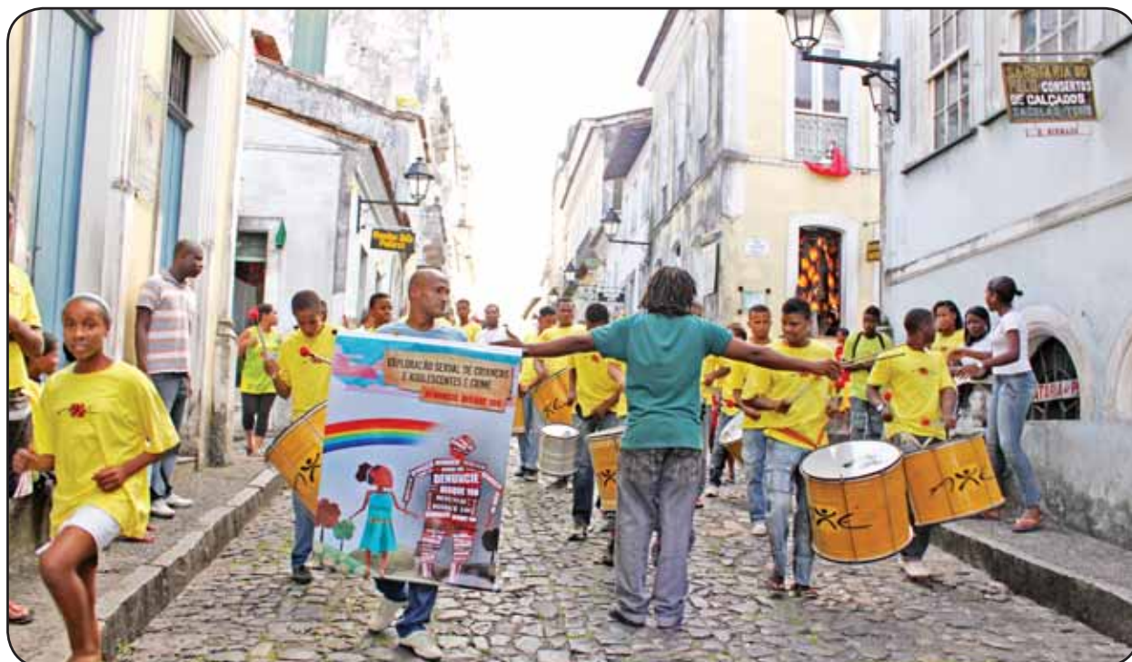
Dia de enfrentamento ao tráfico de Seres Humanos