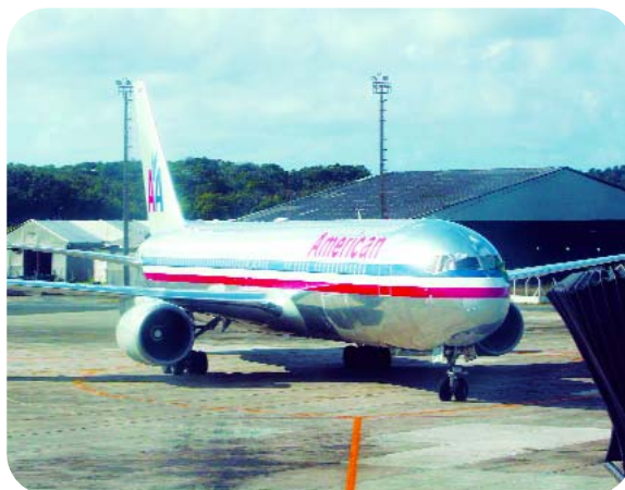
Vôo diário – Salvador – Miami (EUA)

A vocação da Bahia para o Turismo Náutico é reconhecida internacionalmente, mas só agora o setor parece tomar impulso, na expectativa de geração de receitas para o Estado. A SETUR desenvolveu e está empenhada na implementação do Plano Estratégico de Desenvolvimento do Turismo Náutico da Baía de Todos os Santos. Concebido dentro dos marcos da racionalidade, da proteção ao meio ambiente e do enorme potencial da área para as práticas de recreação náutica, o plano entrará em execução no primeiro semestre de 2009.