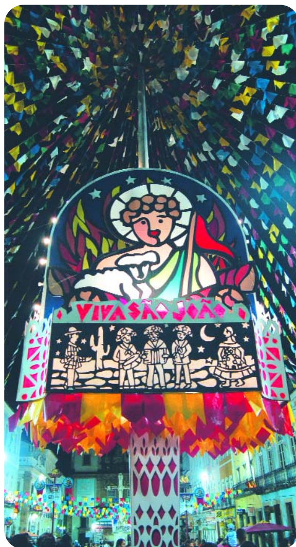
São João Salvador

A Bahia é apresentada a partir das características de cada motivação turística, de cada produto turístico, dentro do conceito que pode ser resumido na frase: A Bahia é muito mais! Para isso, a proposta de diversidade é intensificada com vistas a produzir no inconsciente coletivo um sentimento de que o visitante pode encontrar, na Bahia, praias e montanhas, culinária típica e internacional, diversidade de raças, crenças e ritmos, serviços de hospedagem, alimentação, transporte, agenciamento e entretenimento, conservação dos recursos naturais, com 6,8% do território baiano em áreas protegidas, patrimônio histórico restaurado, autenticidade cultural, hospitalidade, alegria e musicalidade, acessibilidade aérea, terrestre, marítima e fluvial, serviços turísticos certificados e infra-estrutura geral.