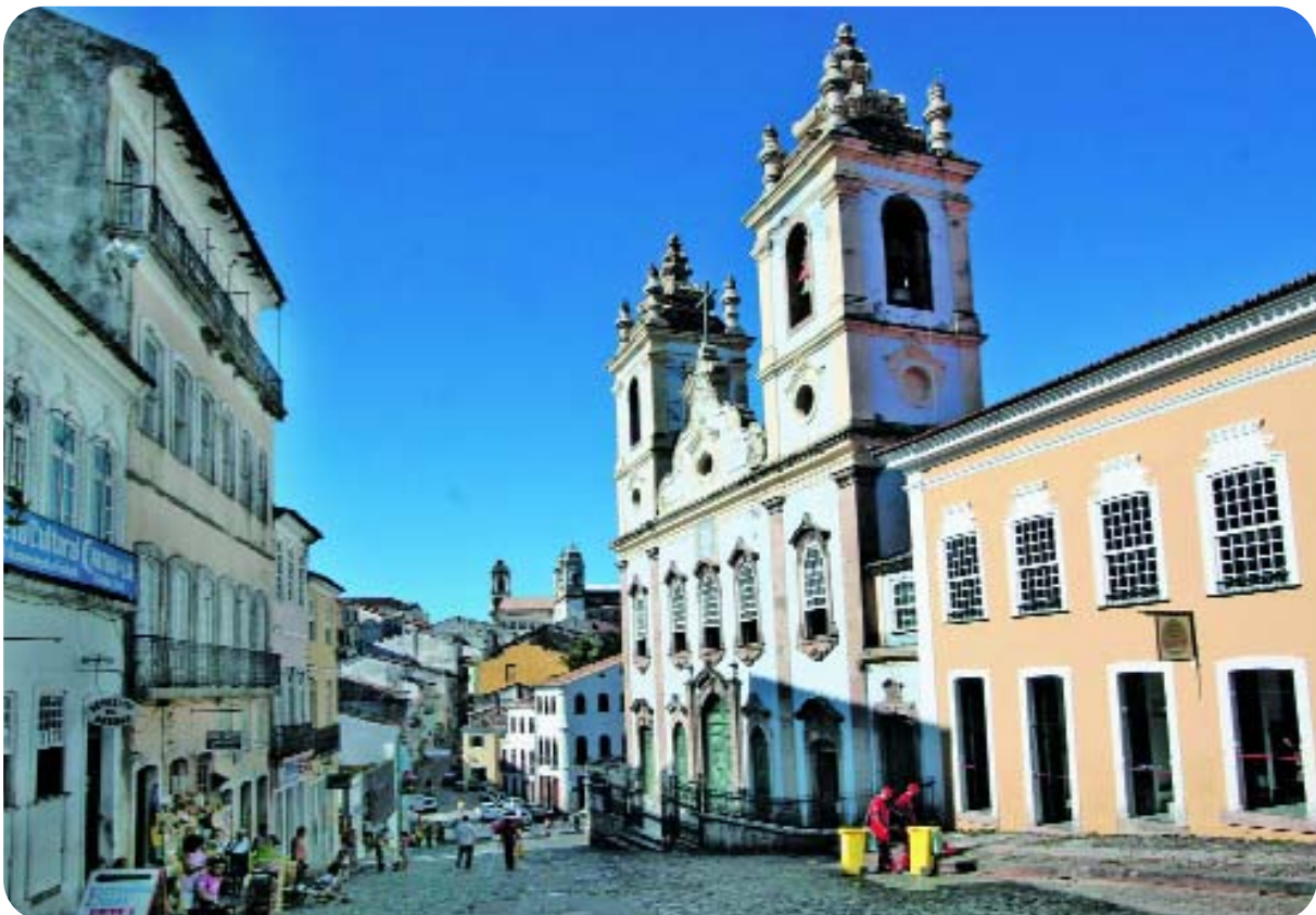
Centro Histórico de Salvador

O eixo da qualificação tem duas vertentes de atuação: a atração e qualificação do fluxo de turistas e a capacitação profissional e empresarial dos serviços turísticos. No primeiro caso, o objetivo é alcançar um patamar mais elevado da taxa de permanência e do índice de gasto médio, além de um maior efeito multiplicador. A conquista