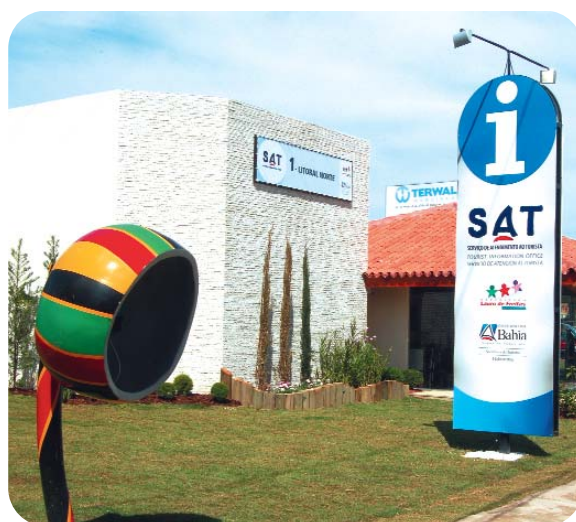
Serviço de Atendimento ao Turista

Já foram inauguradas duas unidades, uma no Pelourinho e outra em Lauro de Freitas. Mais uma unidade, localizada na Praia do Forte, está em implantação para atender à Costa dos Coqueiros. Além de prestar informações turísticas, o SAT também promove ações de