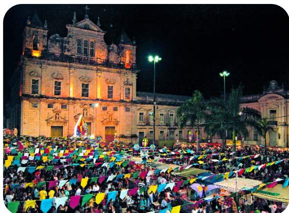
São João – Terreiro de Jesus