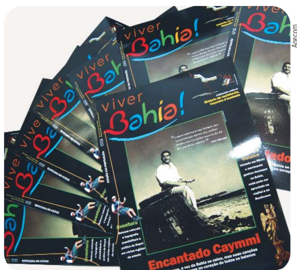
Revista Viver Bahia

Nesse contexto, foram produzidos newsletters dirigidos a públicos específicos, publicações mais adequadas às necessidades de promoção da Bahia, elaboração de cinco edições da Revista Viver Bahia, sendo uma delas totalmente redigida e editada pela unidade de Comunicação da SETUR, além da reformulação total do Portal Oficial de Turismo, o www.bahia.com.br , que passou a ter como foco principal