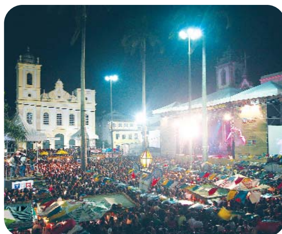
São João – Terreiro de Jesus