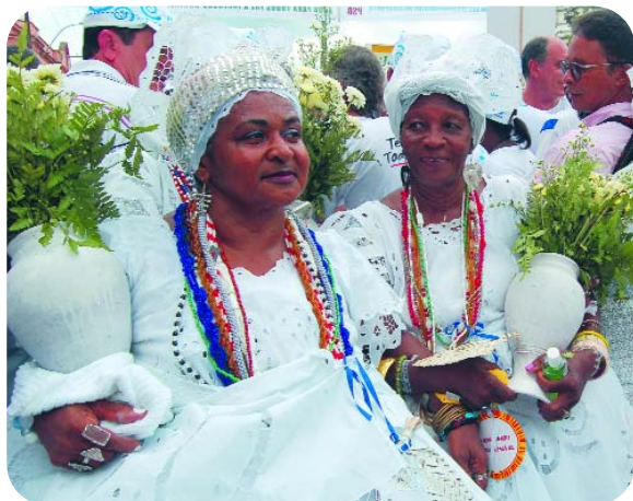
Festa Popular Baiana

Aliado ao turismo étnico, o Turismo Religioso se desenvolve de forma complementar, já que um dos principais elementos da cultura religiosa baiana é o sincretismo. Além dos períodos festivos e das 365 igrejas, e independentemente da sazonalidade, a Bahia pode contar com excepcional atrativo turístico: o Memorial Irmã Dulce.