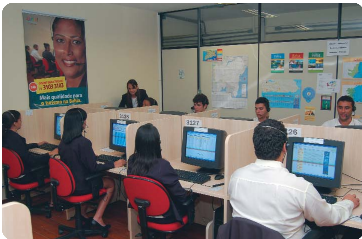
SIMTUR – Disque Bahia Turismo Call Center

Para tanto, foram capacitados 517 profissionais para exercerem a função de guia do carnaval e 71 profissionais para atuarem no serviço de call center. Foram criados postos fixos de trabalho, onde atuaram uma equipe de guias e um coordenador, tendo como principal atividade a prestação de informações aos turistas sobre os serviços que poderiam usufruir durante o carnaval.