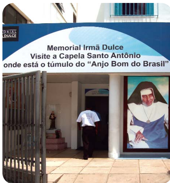
Memorial Irmã Dulce