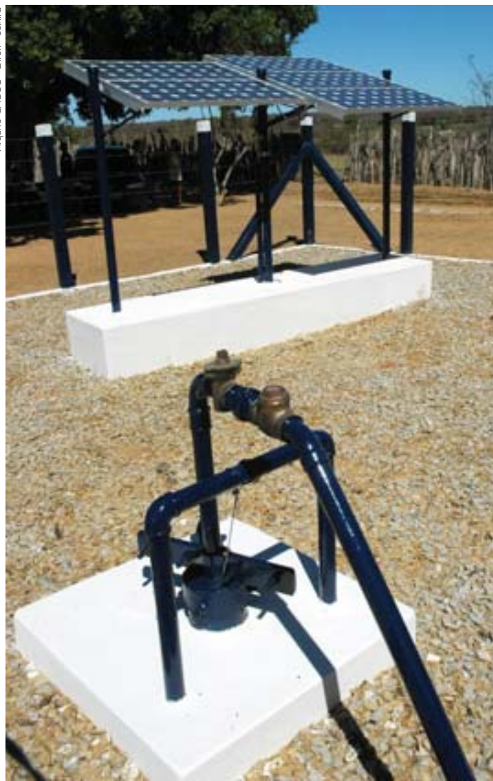
Luz para Todos

No Quadro I são informados os resultados alcançados através dos programas nas áreas de transmissão, distribuição de energia elétrica e efficientização de sistemas de iluminação pública municipal.