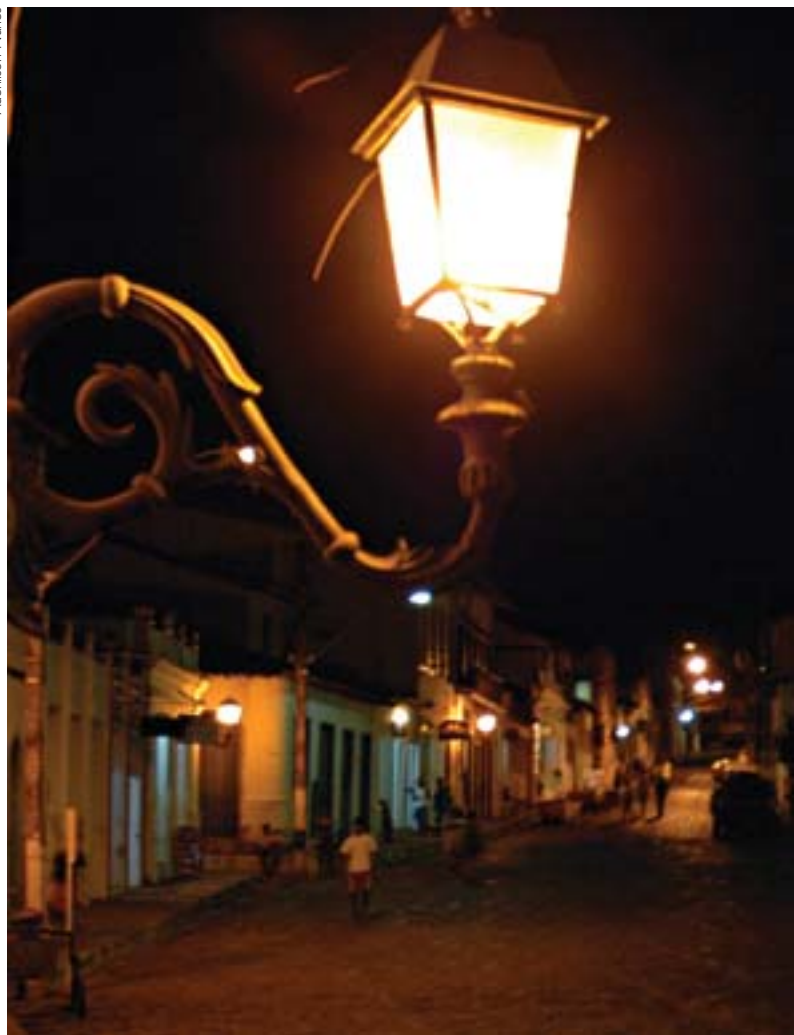
Chapada Diamantina foi beneficiada pelo Prodetur