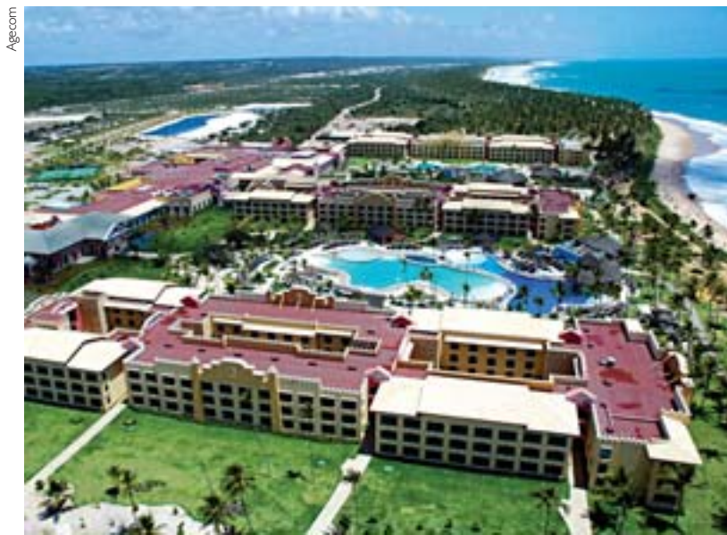
Empreendimento privado inaugurado

a pequenos e médios potenciais investidores que buscam informações sobre as vantagens de se investir na Bahia, motivados pelos contatos nos eventos e através dos portais Bahiainvest, Bahia.com.br e do site www.sct.ba.gov.br .