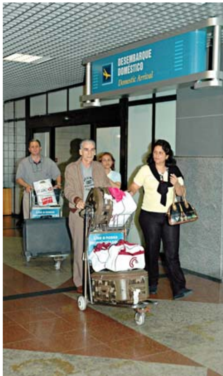
Aeroporto de Salvador