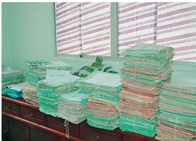
Documentos microfilmados e digitalizados

Dentre os principais serviços a serem disponibilizados pelo Portal WEB PGE destacam-se: acompanhamento de processos em tramitação na Procuradoria; a possibilidade de acesso à legislação