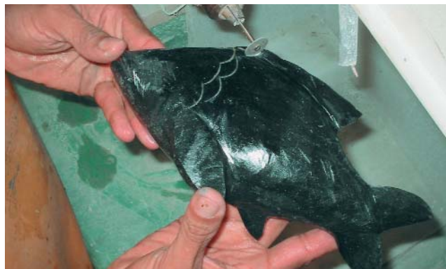
Capacitação em mineral

O Centro Gemológico possui ainda infra-estrutura para a realização de cursos de joalheria, gemologia, bijuteria, lapidação e design de jóias, com grande importância para a capacitação da mão-de-obra local. Foram realizados cursos de gemologia para profissionais ligados ao setor joalheiro, pequenos, médios e