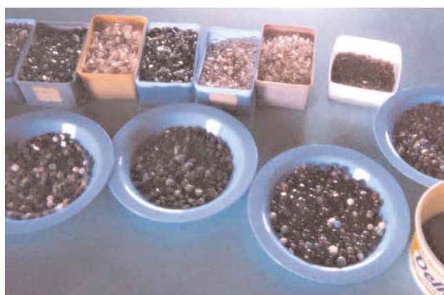
Variedade de minérios

Alguns bens minerais, como as pedras preciosas, também conhecidas como gemas, apresentam mais de 30 variedades em território baiano, com destaque para esmeralda, água-marinha, ametista, diamante, citrino, crisoberilo e cristal-de-rocha. O Estado também possui malaquita, turmalina, quartzo róseo, apatita, calcedônia, amazonita, jaspe, turquesa, sodalita, entre outros.