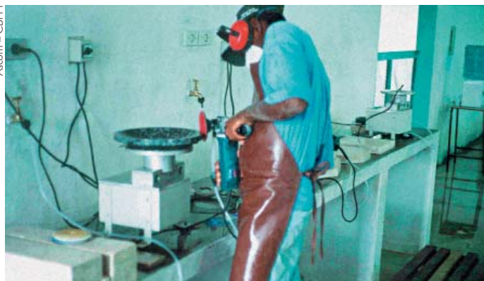
Equipamentos para mineração

Com o objetivo de apoiar o desenvolvimento da mineração da Bahia, o Governo do Estado, através da SICM e da Secretaria de Infra-Estrutura – SEINFRA, realiza um programa de melhorias e