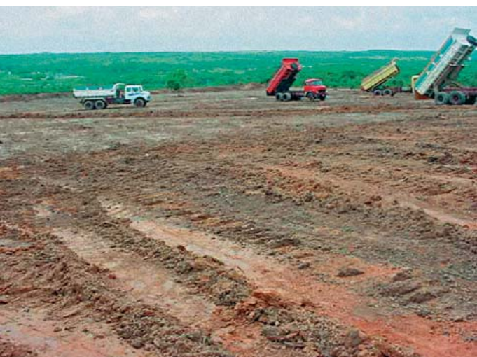
Obras para implantação da Cerâmica Fênix

Nessa região, serão executados três mil metros de sondagem rotativa com recuperação contínua de testemunhos, visando detalhar qualitativa e