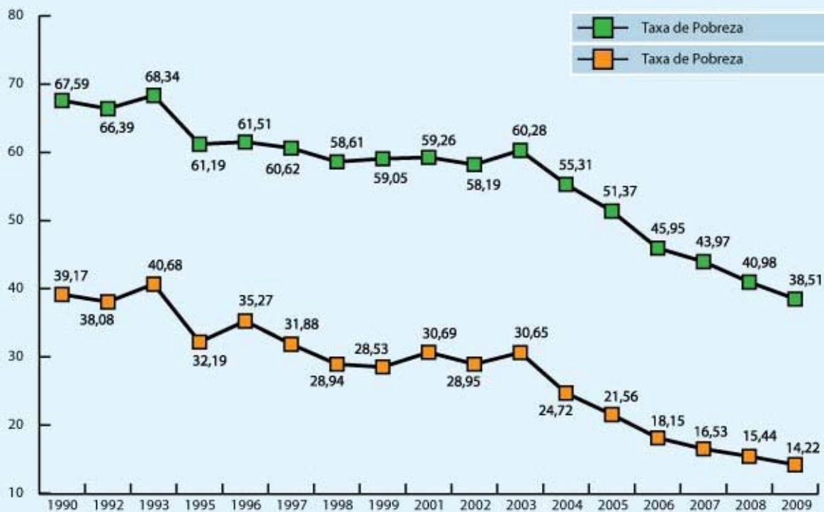
Bahia, 1990 a 2009